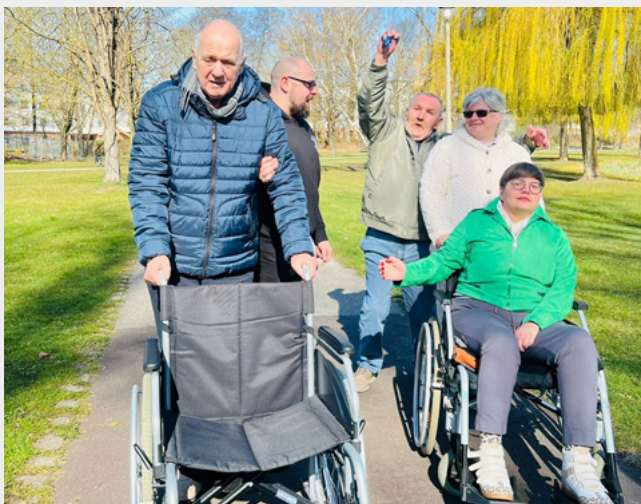
Frühlingsspaziergang mit den Tagesgästen

Ein besonderes Highlight ist dabei der Weichpfuhl, der mit seinen ruhigen Wegen zum gemütlichen Schlendern und Verweilen einlädt. Gerade in dieser Jahreszeit zeigt sich die Natur von ihrer schönsten Seite. Die aufblühenden Kirschblüten verzaubern uns jedes Jahr aufs Neue und sorgen für eine ganz besondere Atmosphäre. Die Farbenpracht, die frische Luft und das Zwitschern der Vögel machen jeden Spaziergang zu einem kleinen Erlebnis.